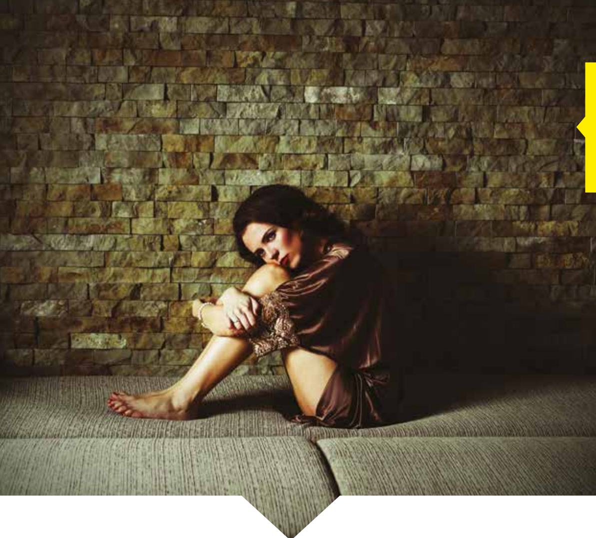
THE STRING QUARTET'S GUIDE TO SEX AND ANXIETY