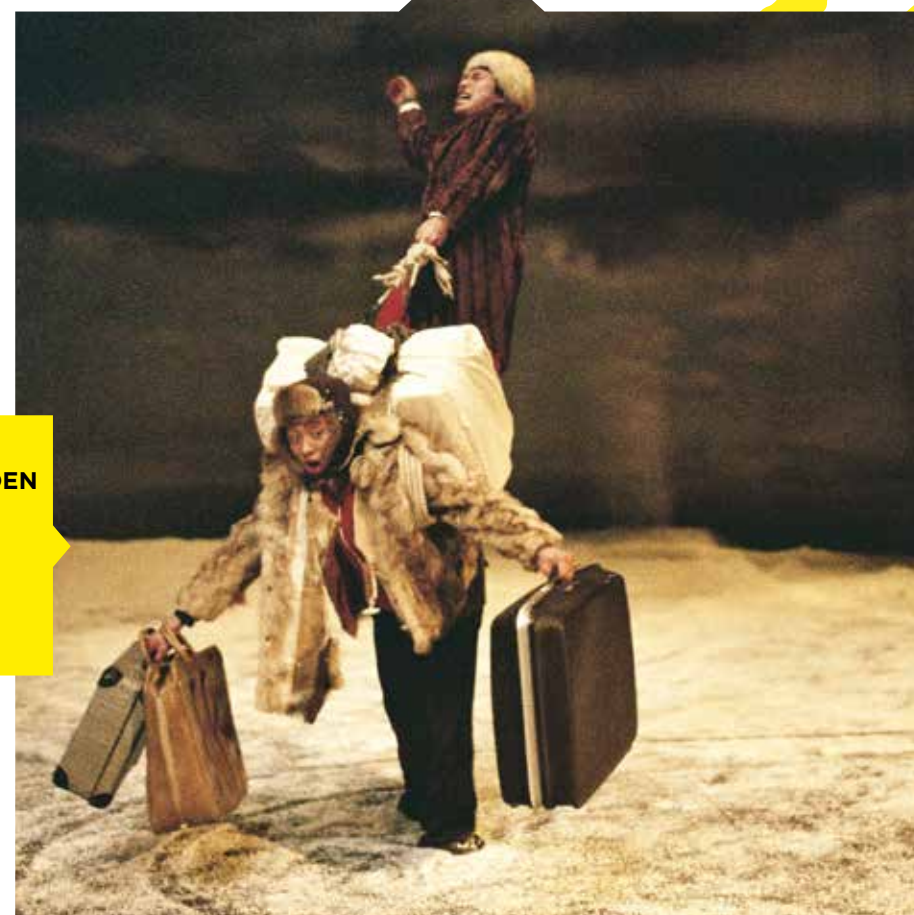
32 RUE VANDENBRANDEN

32 RUE VANDENBRANDEN - 2 JUIN 2018 20h00 - 3 JUIN 2018 17h00